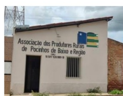
Figura 24 - ASSOCIACAO DOS PRODUTORES RURAIS DE POCINHOS DE BAIXO (CNPJ 10.564.428/0001-10) – Alegrete/PI

42. Já as fiscalizações feitas pelos auditores da CGU revelam a disparidade entre os termos assumidos durante o credenciamento e a realidade encontrada nas salas de aula. A entidade informou no projeto de credenciamento que iria fornecer alimentação nutritiva aos alunos, mas, em vez disso, se limitava a repassar determinado valor em dinheiro ao professor responsável pela turma. No dia da fiscalização, o montante tinha sido revertido em bolachas de água e sal e suco (Nota Técnica CGU nº 1103/2022, 3051699, fls. 68-69, figura 11).