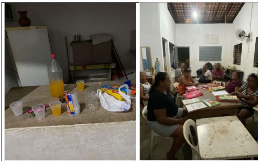
Figura 8 – Alimentação ofertada no local em que estava sendo ministrada aula de alfabetização para turma sob responsabilidade da MSS Lima Resolve (THE Turma 15)