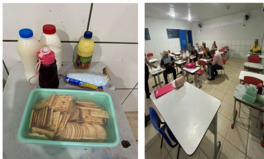
Figura 11 – Alimentação ofertada no local em que estava sendo ministrada aula de alfabetização para turma sob responsabilidade da Associação dos Produtores Rurais de Pocinhos de Baixo (Turma José de Freitas 1)

Fonte: Registros fotográficos feitos durante a visita realizada em 04.05.2022.